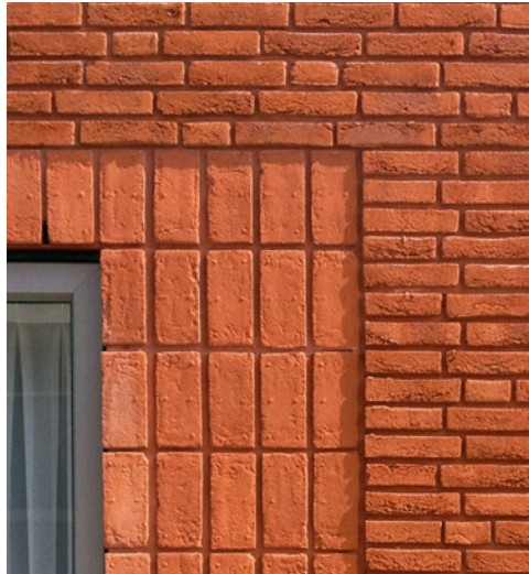
klamp metselwerk als omlijsting van de kozijnen